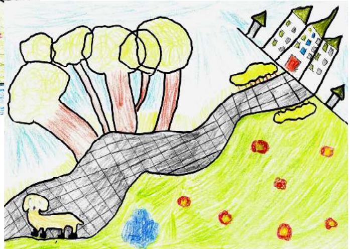
Dessin de Clarisse, Le chien en savates